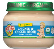
Pollo y caldo de pollo

Exclusivamente para participantes que estén amamantando. Solo alimentos de la marca de productos orgánicos Earth's Best. Solo envases de cristal de 2.5 onzas. Solo los tipos específicos que se indican a continuación.