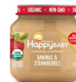
Banana y fresa