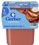
Manzana y cereza