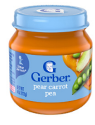
Pera, zanahoria y guisantes