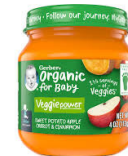
Batata, manzana, zanahoria y canela