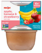
Manzana, banana y fresa

Solo alimentos de la marca Meijer. Envase doble de plástico de 2-4 onzas. Solo los tipos específicos que se indican: