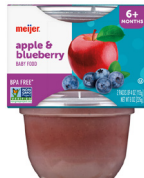
Manzana y arándano