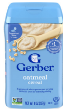
Cereales de avena