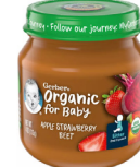
Manzana, fresa y remolacha