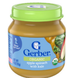
Manzana, espinaca y col rizada