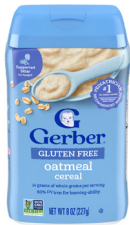
Cereales de avena sin gluten

NO SE PERMITE: con fruta añadida; con DHA/ARA añadido; cereales en frascos; paquetes de variedades.