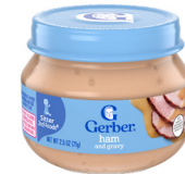
Jamón y salsa