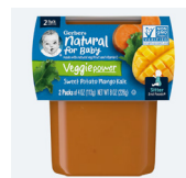
Batata, mango y col rizada