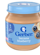
Banana y arándano