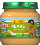
Pera y frambuesa