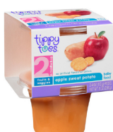
Manzana y batata