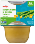
Maíz y judías verdes