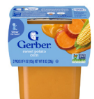
Batata y maíz