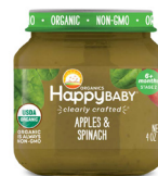
Manzana y espinaca