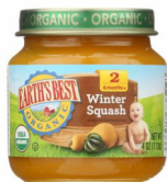
Ayote de invierno