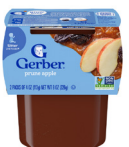
Manzana y ciruela pasa