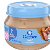
Ternera y salsa

Disponibles exclusivamente para participantes que estén amamantando. Solo alimentos de segunda etapa de la marca Gerber. Solo envases de cristal de 2.5 onzas. Solo los tipos específicos que se indican a continuación.