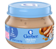
Pollo y salsa