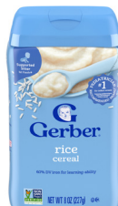
Cereales de arroz