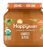
Zanahoria y guisantes