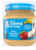
Manzana, fresa y banana

Solo alimentos 2nd Foods de la marca Gerber. Solo envases de vidrio de 4 onzas. Solo los tipos específicos que se indican a continuación.