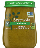
Espinaca, calabacín y guisantes