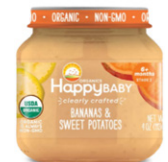
Banana y fresa