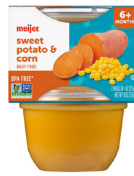
Batata y maíz