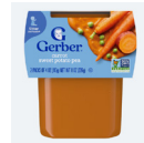
Zanahoria, batata y guisantes