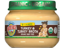
Pavo y caldo de pavo