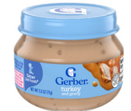
Pavo y salsa