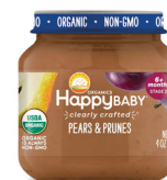
Pera y ciruela pasa